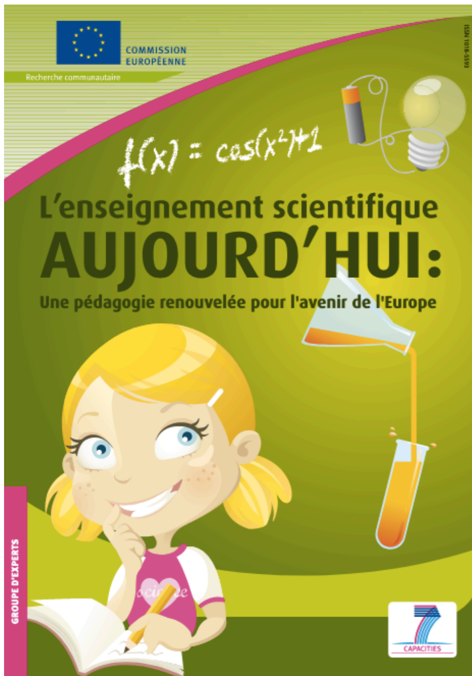
Rapport M. Rocard, 2007